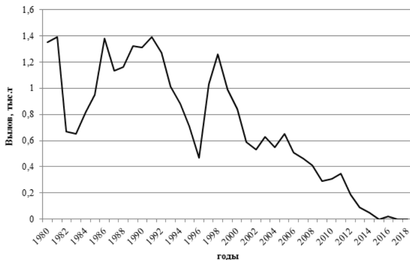
Рис. 1. Динамика вылова муксуна в водных объектах Тюменской области.

делах Омской области, этот вид не отмечает. В проведенных контрольных уловах отсутствовали не только половозрелые особи, но и молодь. Следует отметить, что в пределах Омской области пойменная система у р. Иртыш слабо развита, что может отрицательно сказываться на выживаемости личинок муксуна. Как установлено, степень и продолжительность залития сором в Средней Оби оказывает существенное влияние на урожайность поколений муксуна (Matkovskiy, 2014; Матковский, 2018).