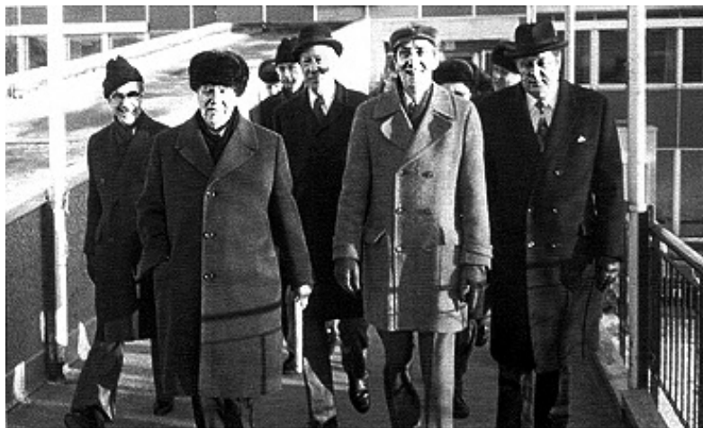
Рис. 2. Министр рыбного хозяйства СССР А. Ишков прибыл в Норвегию в январе 1978 г. для завершения переговоров по смежному участку. Справа от него посол Норвегии в Москве П. Грайвер, рядом с ним министр по морскому праву Норвегии Е. Эвенсен, министр рыболовства Норвегии Э. Болле и посол СССР в Норвегии Ю. Кириченко.

дальнейшем напряженности при работе самой комиссии. Переговоры по этому важнейшему вопросу шли непросто, часто они были на грани срыва ввиду выдвинутого норвежцами первоначального предложения о соотношении раздела трески 70:30 в их пользу. В последующем уже в рамках СРНК была достигнута договоренность по разделу ОДУ по мойве в соотношении 60:40 в пользу норвежской стороны и затем, уже в условиях новой России, по разделу гренландского палтуса — 51:45 в пользу норвежской стороны и 4% для третьих стран. Аналогичные базовые договоренности были достигнуты между российской и норвежской сторонами в рамках СРНК и по выделению ежегодных квот на вылов основных регулируемых рыбных ресурсов Баренцева моря и для третьих стран. Эти решения являются стабилизирующим фактором в работе СРНК вот уже в течение сорока лет.