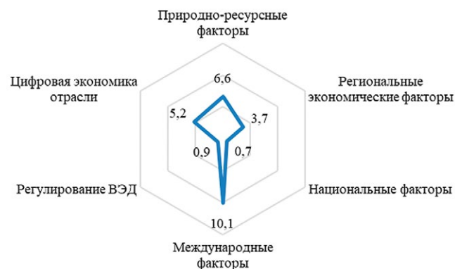
Рис. 3. Распределение степени влияния по группам факторов Fig. 3. Distribution of the degree of influence by groups of factors

чие спроса и существующих рынков сбыта в США (17,5 баллов) и в страны ЮВА (15,5 баллов), так же высокий балл в категории – географическая локализация к азиатским рынкам сбыта рыбной продукции (17). В данной группе только один из показателей набрал отрицательное значение – наличие и степень конкуренции на международных рынках (-3,5).