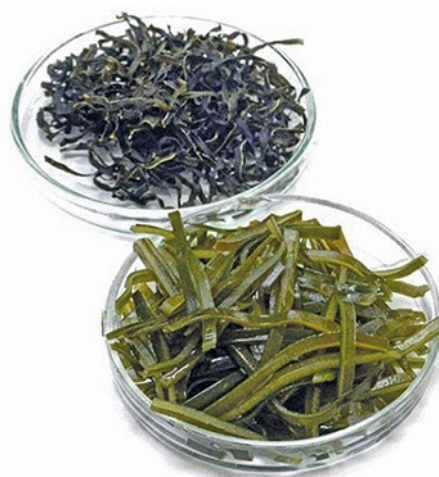
Рис. 3. S. japonica шинкованная сушёная и восстановленная в воде

В состав ламинарий ( S. japonica ) входят и другие не менее ценные биологически активные вещества, например, витамины. Это важнейший класс БАВ, которые организм человека не синтезирует или синтезирует в недостаточном количестве. Поэтому ви-