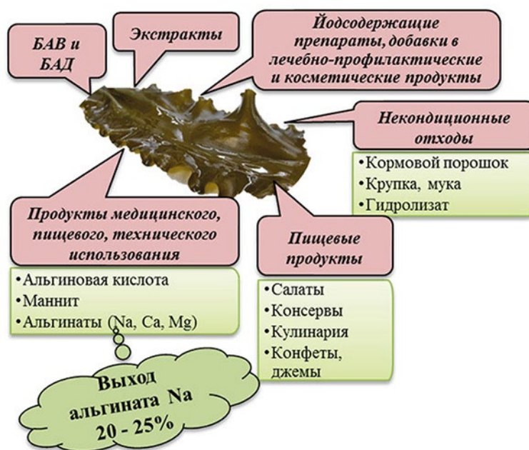
Рис. 4. Направления использования ламинарии и продуктов её переработки

пустимых уровней по микробиологическим показателям, токсичных элементов, радионуклидов обнаружено не было, и поэтому они могут быть использованы в качестве основы пищевых продуктов, а также для производства медицинской, технической, биоактивных веществ, БАД и другой разнообразной продукции (рис. 4).