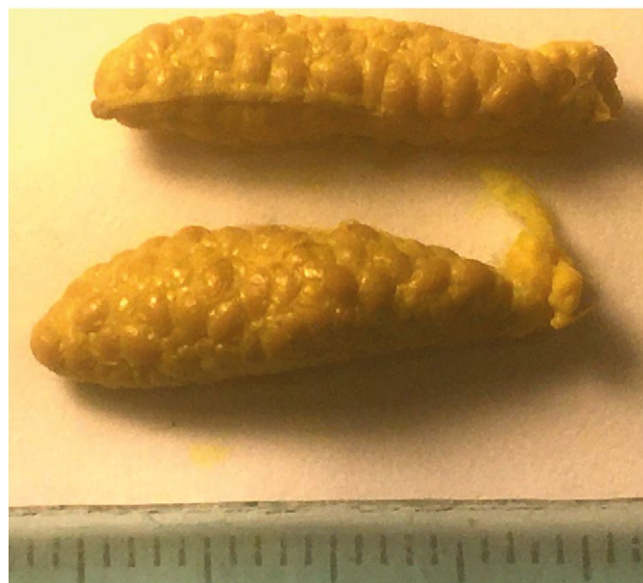
Рис. 2. Внешний вид яичников у самок мозамбикской тилапии в возрасте 171 сут.

[Ивойлов, 1986 2 ]. При удовлетворительных условиях содержания, достигнув половой зрелости, они нерестятся через каждые 30–40 сут. В результате, в их гонадах можно видеть ооциты разных генераций, в т. ч. и ооциты периода вителлогенеза. Это обстоятельство