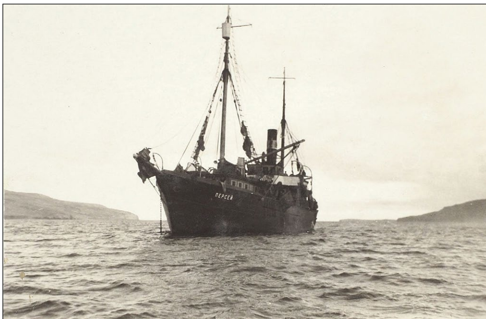
Научно-исследовательское судно «Персей»

В целом, корабль был хорошо оснащён для комплексных морских исследований. Запас угля позволял находиться в рейсе до 30–32 суток, однако, запас пресной воды лимитировал продолжительность рейса до 15–17 суток. Для продления рейса участники экспедиций специально выходили на берег, используя любую возможность восполнить запас чистой пресной воды из многочисленных ручьёв и речек.