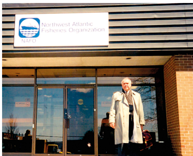
У штаб-квартиры НАФО. Галифакс, 1998 г.