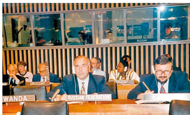
На конференции ООН по разработке Соглашения о трансграничных рыбных запасах. Нью-Йорк, 1995 г.