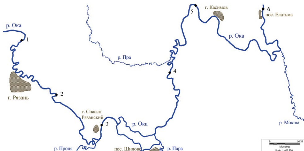
Рис. 1. Карта-схема учётных станций на р. Оке в границах Рязанской области в 2019 г.