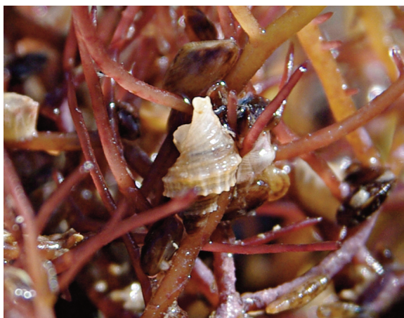
Рис. 1. Молодь рапаны, осевшая на экспериментальный садок с грациллярией, экспонированный в толще воды на ферме по выращиванию моллюсков близ мыса Большой Утриш. Высота раковины рапаны составляет 6 мм, срок экспозиции — с июля 2007 по апрель 2008 гг., глубина экспозиции 4 м, глубина моря в районе размещения садка 28 м

В 2008–2010 гг. в открытой части Чёрного моря (контрольный разрез на акватории Анапской банки на траверзе Бугазского Гирла) на рыхлых грунтах в диапазоне глубин от уреза воды до 6–7 м плотность распределения ра-