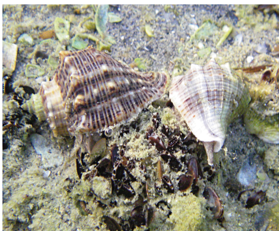
Рис. 3. Июнь 2009 г. Годовики рапаны, поедающие друзды митилястера в Бугазском лимане Чёрного моря. Высота раковины 22–34 мм

В летний период 2007 г. было отмечено проникновение рапаны на акваторию Кизилташского лимана Чёрного моря. Единичные особи рапаны с высотой раковины от 40 до 90 мм были отмечены на расстоянии 200–300 м от Гирла, соединяющего лиман с Чёрным морем. Молодь отмечена не была, хотя повсеместно отмечалось спаривание рапаны и откладка коконов с икрой. Летом 2008 г. в лимане близ Гирла в массе отмечалась молодь рапаны с высотой раковины до 10 мм; в 2009 г. — годовики с модальным размером 22–34 мм по высоте раковины (рис. 3) и отдельные особи промыслового размера; в 2010 г. — особи с модальным размером порядка 50–55 мм (рис. 4).